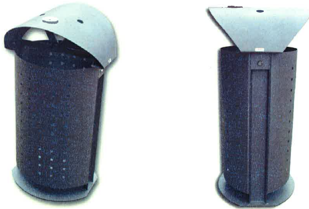
Projektētās urnas uzstādīšanas piemērs