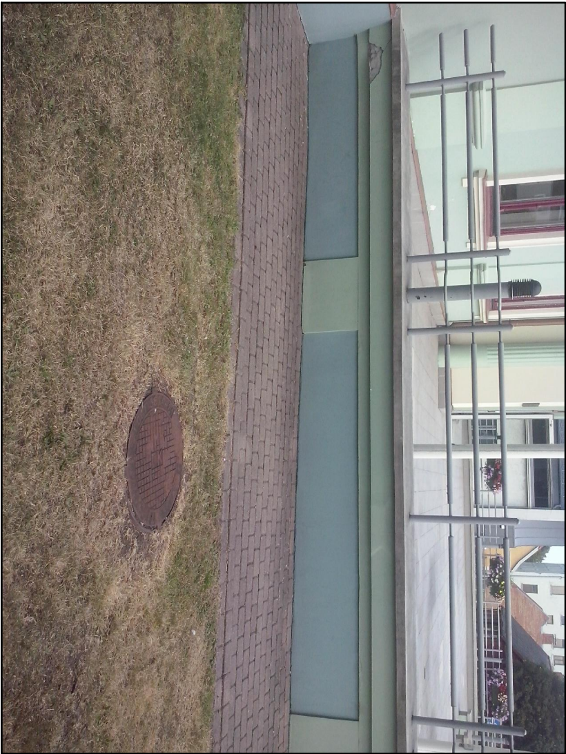
PANDUSA IZBŪVES VIETAS FOTOFIKSĀCIJA