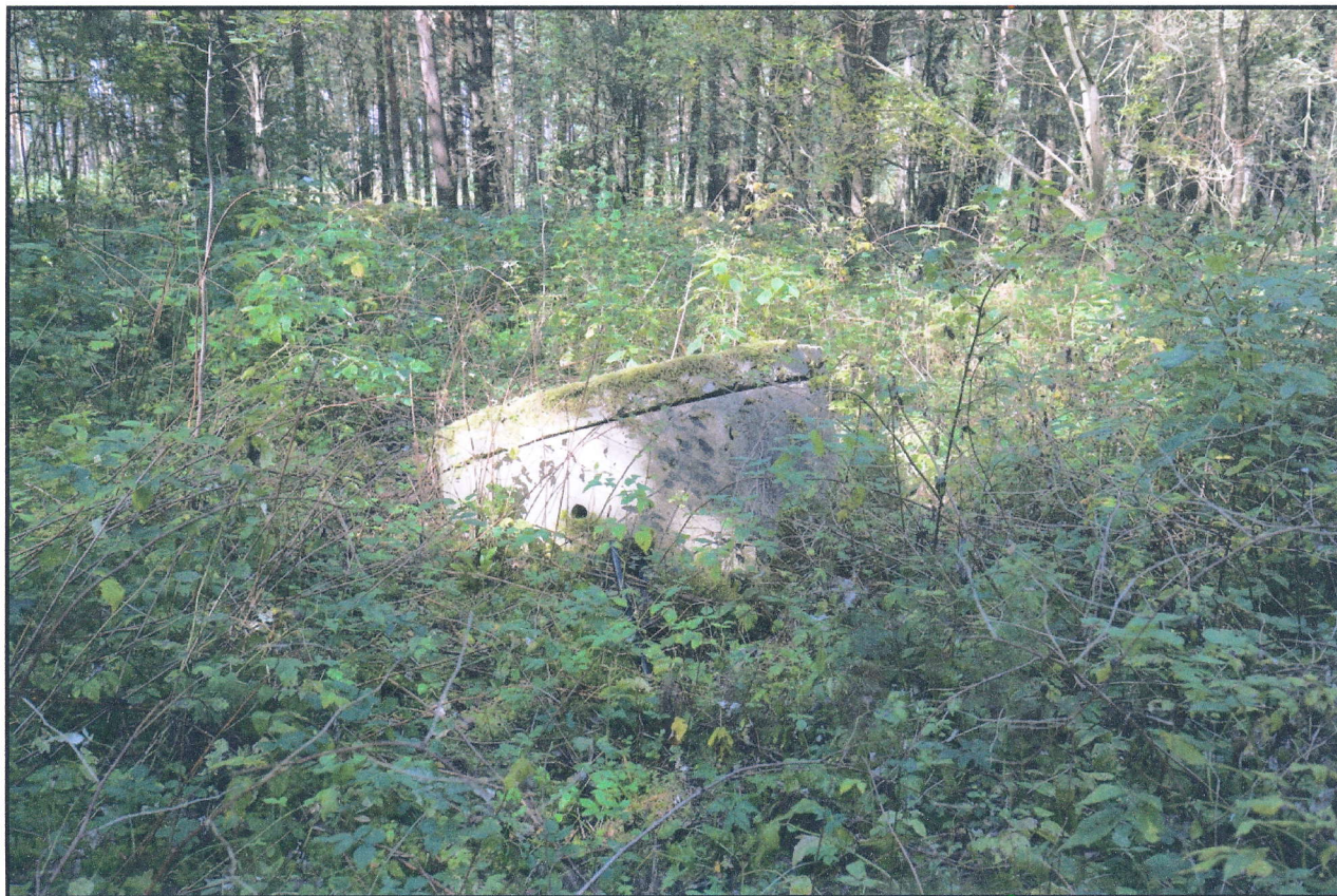
Urbums Nr. 4233